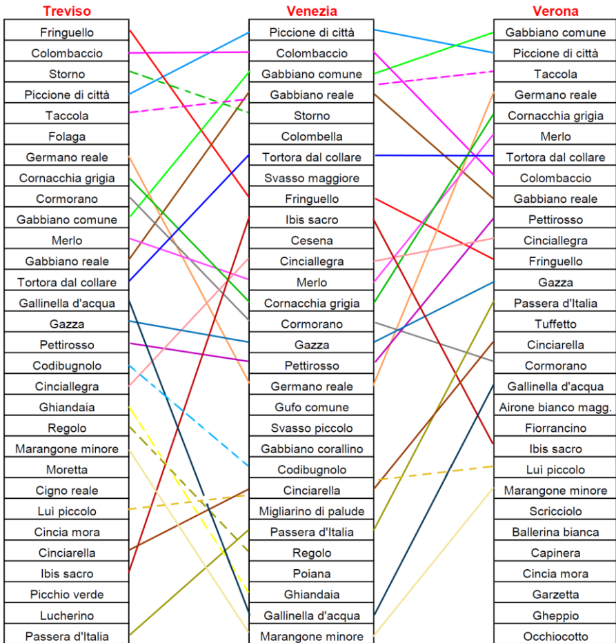
Tabella 6. Confronto tra le prima 30 specie, ordinate secondo l'abbondanza, tra le provincie con almeno un'ora totale di osservazione (Treviso, Venezia, Verona). Sono evidenziate con linee colorate le specie comuni alle tre provincie, con linee colorate tratteggiate le specie comuni a solo due provincie.