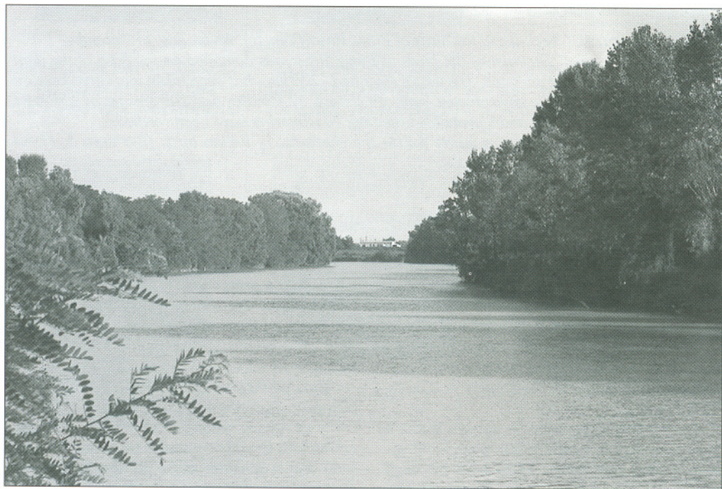
Particolare del basso corso del fiume a S. Donà di Piave (VE) (A. Nardo)