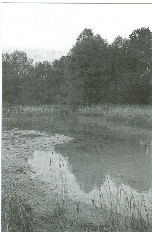
Ambiente di lanca nel basso corso del fiume Piave (A. Nardo)